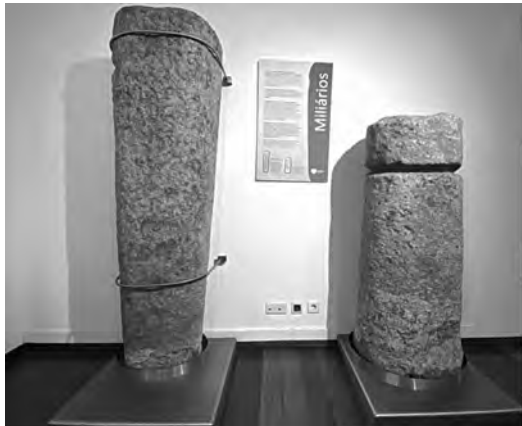
OS EXEMPLARES QUE AQUI PODEMOS OBSERVAR FORAM ENCONTRADOS NOS FINAIS DO SÉCULO XIX, NA SEQUÊNCIA DE OBRAS REALIZADAS NA ANTIGA ESTRADA REAL DE PORTO A BRAGA, EM SANTIAGO DE BOUGADO. POSTERIORMENTE, FORAM COLOCADOS JUNTO À PONTE DA TROFA VELHA DO MESMO LUGAR POR INICIATIVA DO ABADÉ PEDROSA. AÍ PERMANECERAM ATÉ AO ANO 2000, SENDO DEPOIS INSTALADOS NA CASA DA CULTURA DA TROFA EM EXPOSIÇÃO PERMANENTE.

A cultura romana faz parte da história do nosso país e também do imaginário de muitos, sonhando com aquela grandeza que é possível visualizar nos vários livros, séries e até mesmo na tentativa de narrativa que os professores de história iam tentando imprimir nas suas aulas.