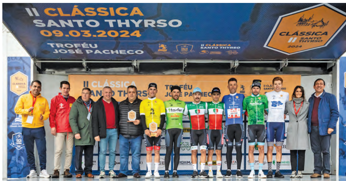
PROVA FOI PONTUÁVEL PARA A TAÇA DE PORTUGAL