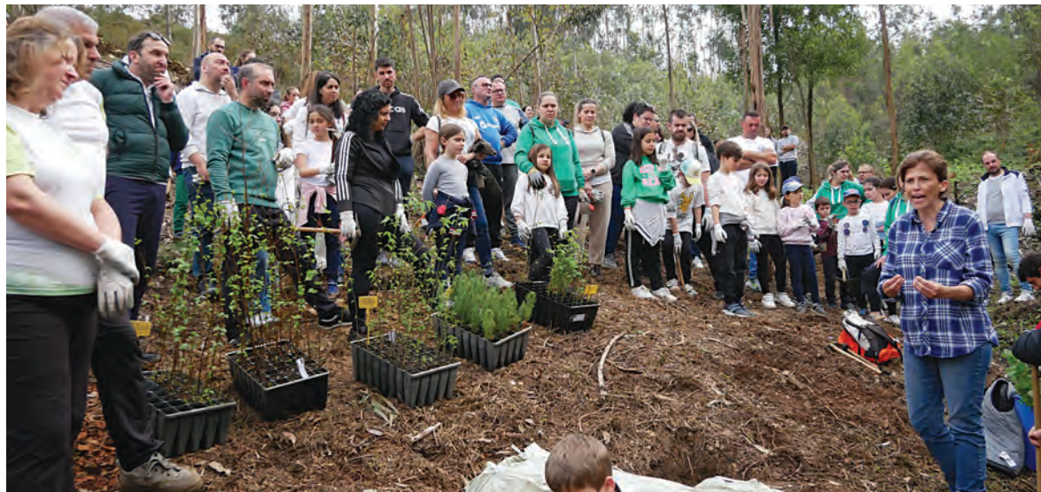
AÇÃO CONTOU COM PARTICIPAÇÃO DE VÁRIAS DEZENAS DE VOLUNTÁRIOS

Associações, escuteiros e famílias, miúdos e graúdos reuniram-