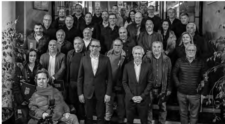
AUTARQUIA CONCEDE 223 MIL EUROS EM APOIOS

Foram contemplados a Associação Desportiva Oliveirense, do Grupo Desportivo de Joane, da Associação Desportiva Ninsense, do Operário Futebol Clube, do Desportivo de S. Cosme, do Clube Desportivo de Lousado, do Grupo Desportivo do Louro, do Grupo Desportivo de Cavalões, da União Desportiva de