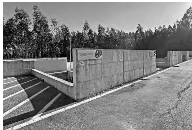
EQUIPAMENTO PERMITIRÁ ÀS EMPRESAS DEPOSITAR OS SEUS RESÍDUOS VALORIZÁVEIS

Para o esclarecimento de dúvidas, os interessados podem contactar gratuitamente a Linha da Reciclagem, através do número 800 911 400.