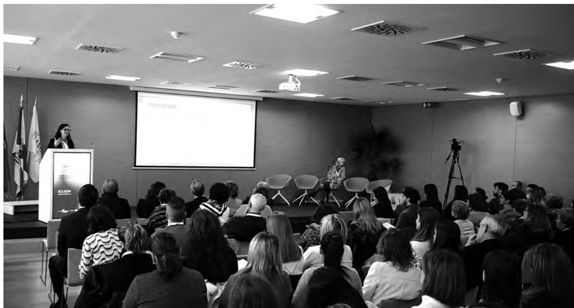
DESTACADA PARTICIPAÇÃO SIGNIFICATIVA DE EQUIPAS DE CUIDADORES E TÉCNICOS

Ao abordar a redução do papel da pessoa idosa ao de beneficiário de cuidados, a diretora geral da Misericórdia enfatizou a importância de reconhecer esta população como indivíduos dignos, com direitos e preferências. Realçou, também, a necessidade de proporcionar um ambiente onde os idosos possam