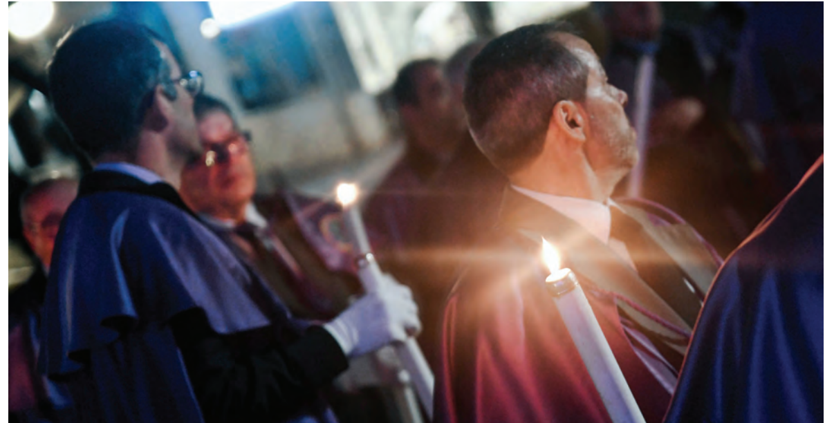
FAMALICÃO ELABOROU PROGRAMA EXTENSO DE ATIVIDADES RELACIONADAS COM A PÁSCOA

A 28 de março, o destaque vai para a recriação da “Última Ceia”, na Praça 9 de Abril, às 21h00, e para a Procissão do Senhor da Cana Verde – ‘Senhor Ecce-Homo’, meia hora depois, com início na Igreja Matriz Antiga. A recriação do Julgamento de Jesus no Pretório, a celebração da Paixão do Senhor e a procissão do Enterro do Senhor, acontecem no dia seguin-