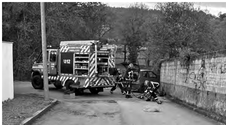
VÍTIMA SEGUIA SOZINHA NA VIATURA

O acidente aconteceu cerca das 17h50, e os primeiros a chegar ao local foram os elementos da Cruz Vermelha de Ribeirão. As operações de socorro foram, de seguida, alargadas aos Bombeiros