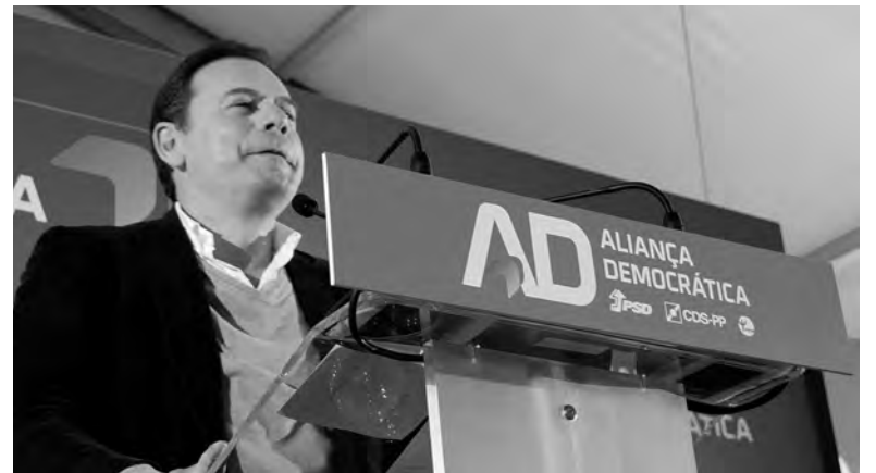
FAMALICENSES DERAM VITÓRIA CONFORTÁVEL À AD

O BE, que obteve 4,47% (1967 votos), viu ainda a IL superiorizar-se, com 4,97% (2188 votos). Um dos maiores crescimentos foi do Livre, que conquistou 2,5%, correspondente a 1102 votos, mais 784 que nas eleições passadas.