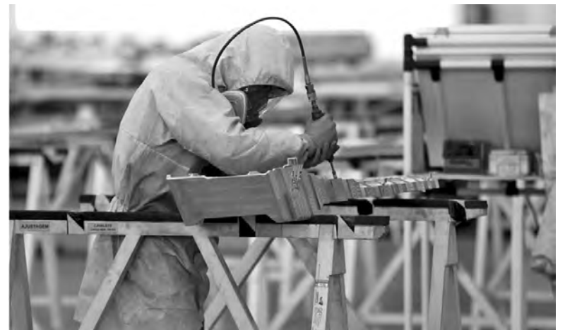
EMPRESA ENVOLVIDA EM PROJETO DE 4,55 MILHÕES DE EUROS

motive’, liderado pela Mobinov – Associação do Cluster Automóvel de Portugal, acolhe nove entidades, envolvendo a ESI Robotics, a Continental Advanced Antenna, Matching Ventures, Pro-grow, a incubadora IEFF da Figueira da Foz, CEiiA, o Instituto Superior Técnico e o INESC TEC – Instituto de Engenharia de Sistemas e Computado-