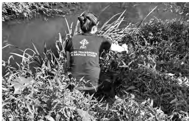
PAN DEFENDE CRIAÇÃO DE ESTRATÉGIA DE DESPOLUIÇÃO DOS RIOS E RIBEIRAS

Em nota informativa enviada pouco antes do Dia Mundial da Água, o PAN considera insufi-