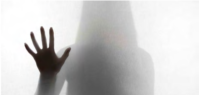
VÍTIMA FOI AMEAÇADA COM ARMA BRANCA

Os militares da GNR do Posto de Vila das Aves detiveram, a 13 de março, um homem de 56 anos, por violência doméstica, no concelho de Santo Tirso.