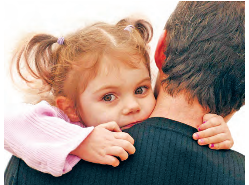
MUNDOS DE VIDA PROMOVE SERVIÇO ESPECIALIZADO DE ACOLHIMENTO

Se vive nos distritos do Porto ou de Braga e já pensou ser família de acolhimento de crianças ou gostava de ter mais informação, contacte o serviço de Acolhimento Familiar da Mundos de Vida e inscreva-se para participar numa Sessão Informativa, para esclarecer todas as dúvidas. Após este passo, e se quiser candidatar-se, fará for-